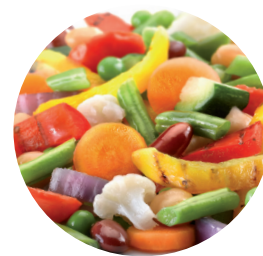
Готовые овощные блюда (салаты, закуски)