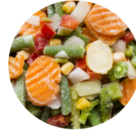
Готовые плодово-овощные закуски глубокой заморозки