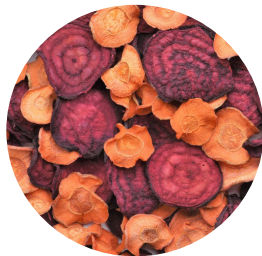
Сушеные органические овощи (чипсы, стрипсы, порошки)