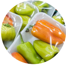
Фасованные свежие овощи