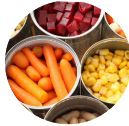
Консервированные овощные полуфабрикаты