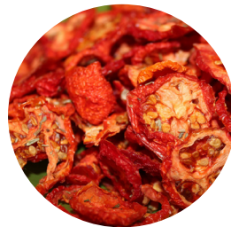
Вяленые органические овощи