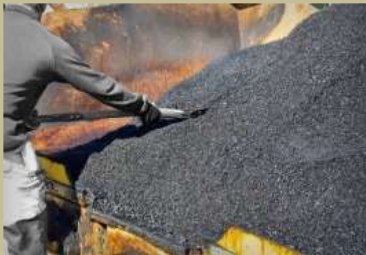
Производство асфальтобетонных смесей -998 тонн