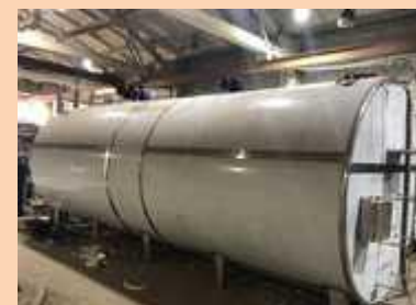
Наличие 1 молокоприемного пункта