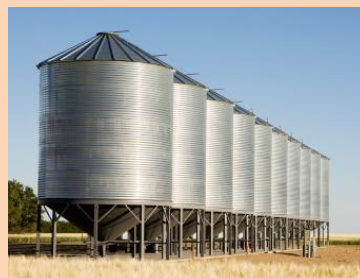
Наличие 19 зернотоков (зернохранилищ), 2 элеватора