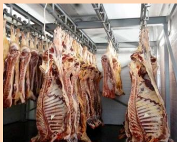
Наличие 1 убойного цеха