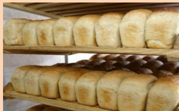
Производство хлеба и хлебобулочных изделий – 150 тонн