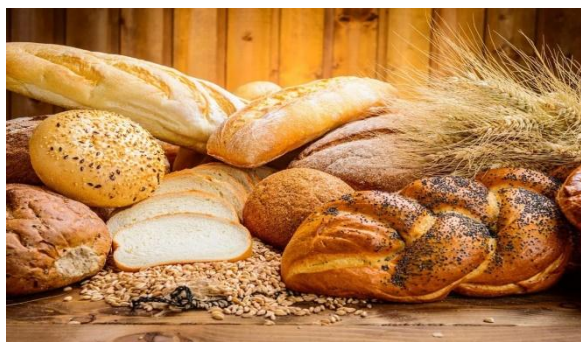
ИП Гаделия И.Т.

Производство хлеба и хлебобулочных изделий