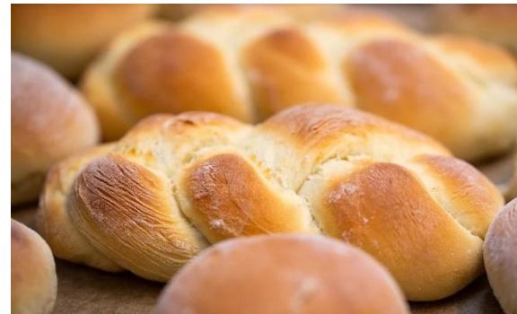
ИП Антонян А.Г.

Производство хлеба и хлебобулочных изделий