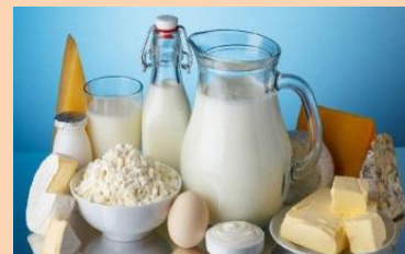
Производство молочной продукции – 10,3 тонн; Производство сыров – 13,9 тонн