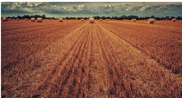
ООО «Сибирские семена»

Сельскохозяйственная организация, специализирующаяся на выращивании зерновых, зернобобовых культур и производстве молока.