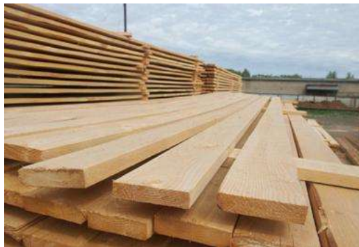
ИП Сычев О.В

Занимаются производством деревообрабатывающих изделий