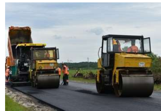
ГП Омской области «Тевризское ДРСУ»

Занимаются производством пара и горячей воды (тепловой энергии) котельными