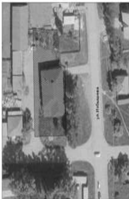
СХЕМА ЗЕМЕЛЬНОГО УЧАСТКА С. БОЛЬШИЕ УКИ, УЛ. ИЗЫШЕВА, 17