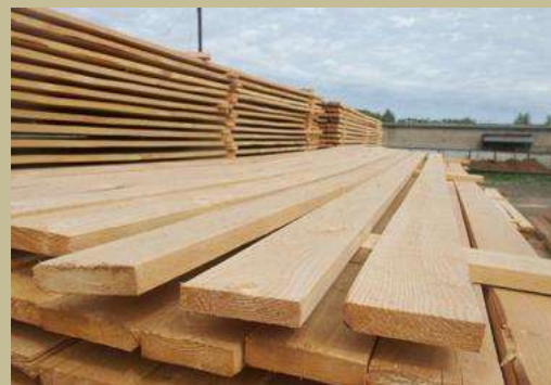
Заготовка древесины – 17 241 куб. м.