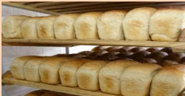
Производство хлеба и хлебобулочных изделий – 179 тонн