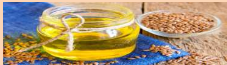
Производство льняного масла, семена льна