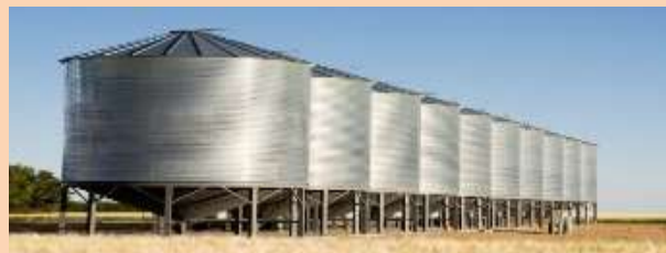
Наличие 1 зернотока (зернохранилища)